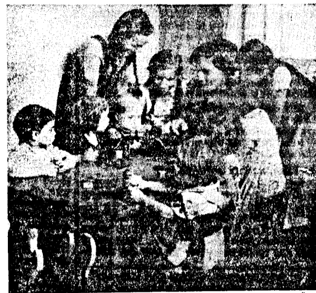
Kleine „Wichte“ im Waisenhaus bei ihrem fröhlichen Spiel

Im Evangelischen Waisenhaus, dem auf der rechten Seite im Anfang der Wiendenbrücker Straße stehenden Zweistöckgebäude, treffen wir eine Anzahl heller und behaglicher Zimmer an, in die das Haus aufgeteilt ist.